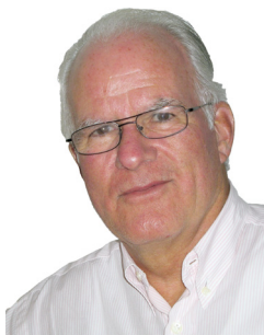
Walter Weder Media.Research. Group

mediatonic belegt im Agenturrating Mediaagenturen seit vielen Jahren den zweiten Platz. So auch 2021 wieder. Vor einem Jahr ist es ihr beinahe gelungen, den langjährigen Sieger des Awards vom Thron zu stossen. Ganze 0.03 Punkte haben ihr gefehlt. Auch in diesem Jahr ist es wieder eng geworden. 0.1 Punkte beträgt der Abstand diesmal. Ein tolles Ergebnis, das man erst einmal so hinkriegen muss. Eine Leistung, die bei vielen Mitstreitern Bewunderung und Anerkennung auslöst.